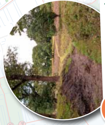
4 Archeologisch reservaat De Strubben/Kniphorstbosch