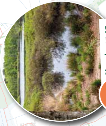
2 Stiepelveen en Zeegser Duinen