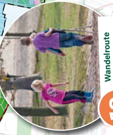
13 Wandelroute Sprokkelspoor