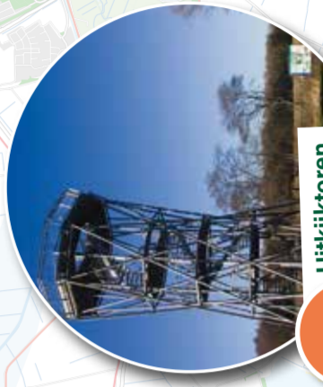
11 Uitzichtoren Holmers-Halkenbroek