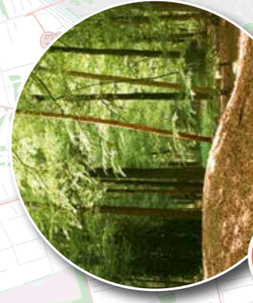
7 Kampsheide en Tumuilbos