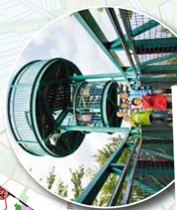
10 Buitencentrum Boomkroonpad