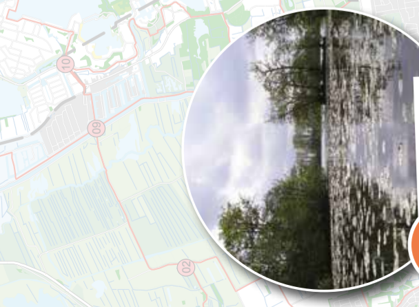
1 Vogelkijkhut Friescheveen