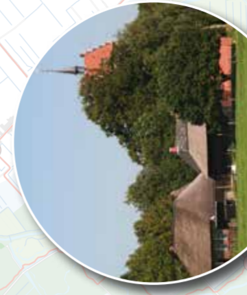
5 Beekdal Anloërdiepje met dorpsrand (beschermd dorpsgezicht) Anloo