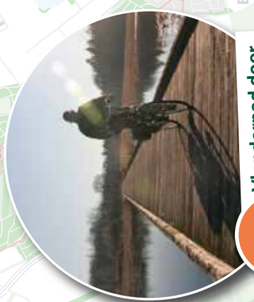
12 Vionderpad door Grolloërveen