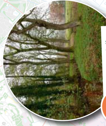
8 Rondwandeling Acht van Amen