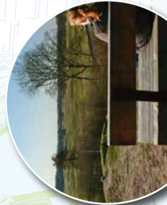
3 Belvedère Kymmelsberg

HERINNERINGSCENTRUM - KAMP WESTERBORK Oosthalen 8, 9414 TG Hooghalen