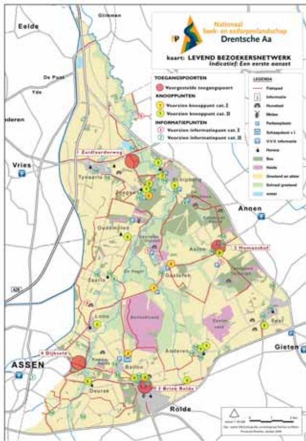
Fig. 4: de basiskaart van het Levend Bezoekersnetwerk NBEL

Zie ook bijlage 1.