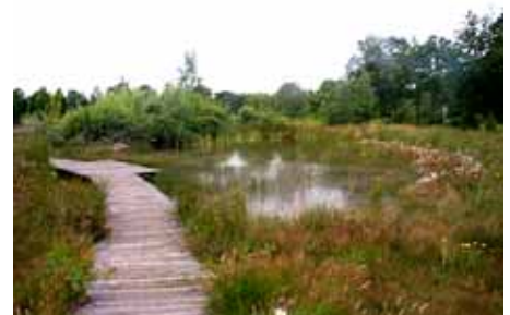
Vlonderpad Bezoekerscentrum Dwingelderveld