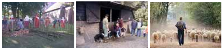
De gastheren- en vrouwen zijn al druk doende

Deze uitdagingen zijn grotendeels verwerkt in de aanbevelingen. In het volgende hoofdstuk van dit Plan van Aanpak zullen deze worden benoemd.