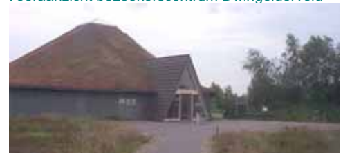
Voorbeeld bezoekerscentrum Dwingelderveld