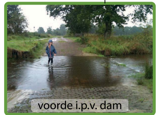
voorde i.p.v. dam