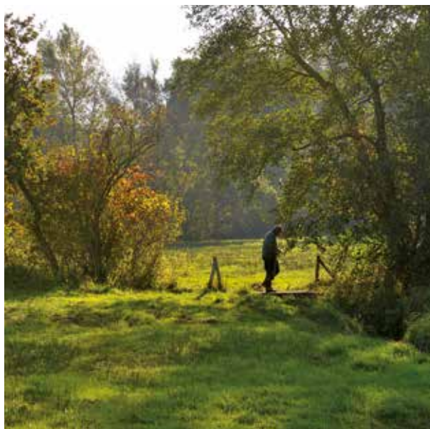
Droom weg bij de stilte tussen de houtwallen.

Voor een beleving van de intieme sfeer van het Drentse Beek- en esdorpenlandschap hoeft u niet ver te zoeken. Op een steenworp afstand van het informatiecentrum Homanshof in Anloo waant u zich in de middeleeuwen, toen dit cultuurlandschap ontstond. Bomenrijen lopen door tot aan de beek, die als levensader door het dal stroomt. Daartussen liggen de hooilanden als groene kamers. Hier werd vroeger wintervoer voor het vee geogst. Leunend over een oud boerenhek dwalen uw gedachten gemakkelijk af naar toen. Nog steeds ademt het 'kamertjeslandschap' de geest van middeleeuwse boeren.