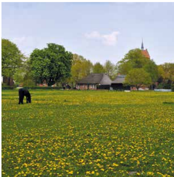
De Es van Anloo.