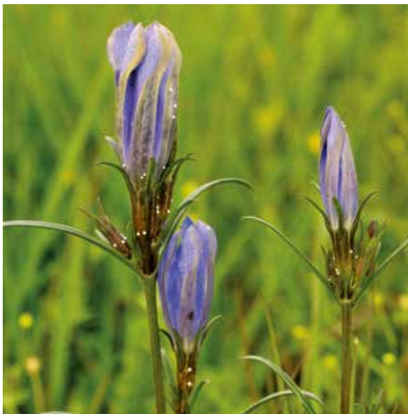
Klokjesgentiaan met eitjes.

plekken herkent u aan struikheide. Zeldzame soorten zijn bijvoorbeeld het gele valkruid (Arnica) en wilde orchideeën.